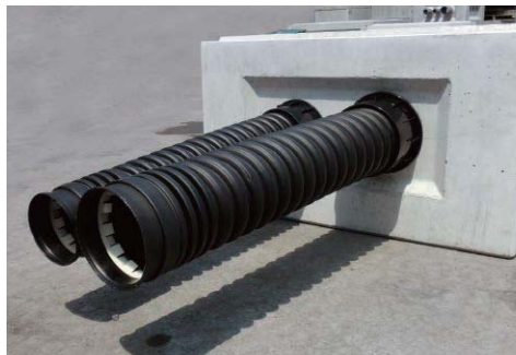
ハンドホール接続例